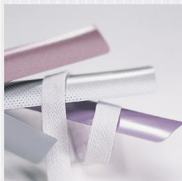
Lameller och vävda band finns i flera färger