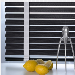
Modernt utseende med aluminiumlameller och breda vävda band