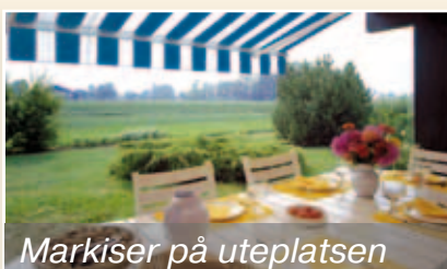
Markiser på uteplatsen