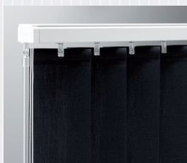
Med vridstång och lina