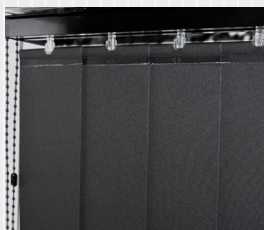
Skena, reglageliner och beslag i svart utförande.